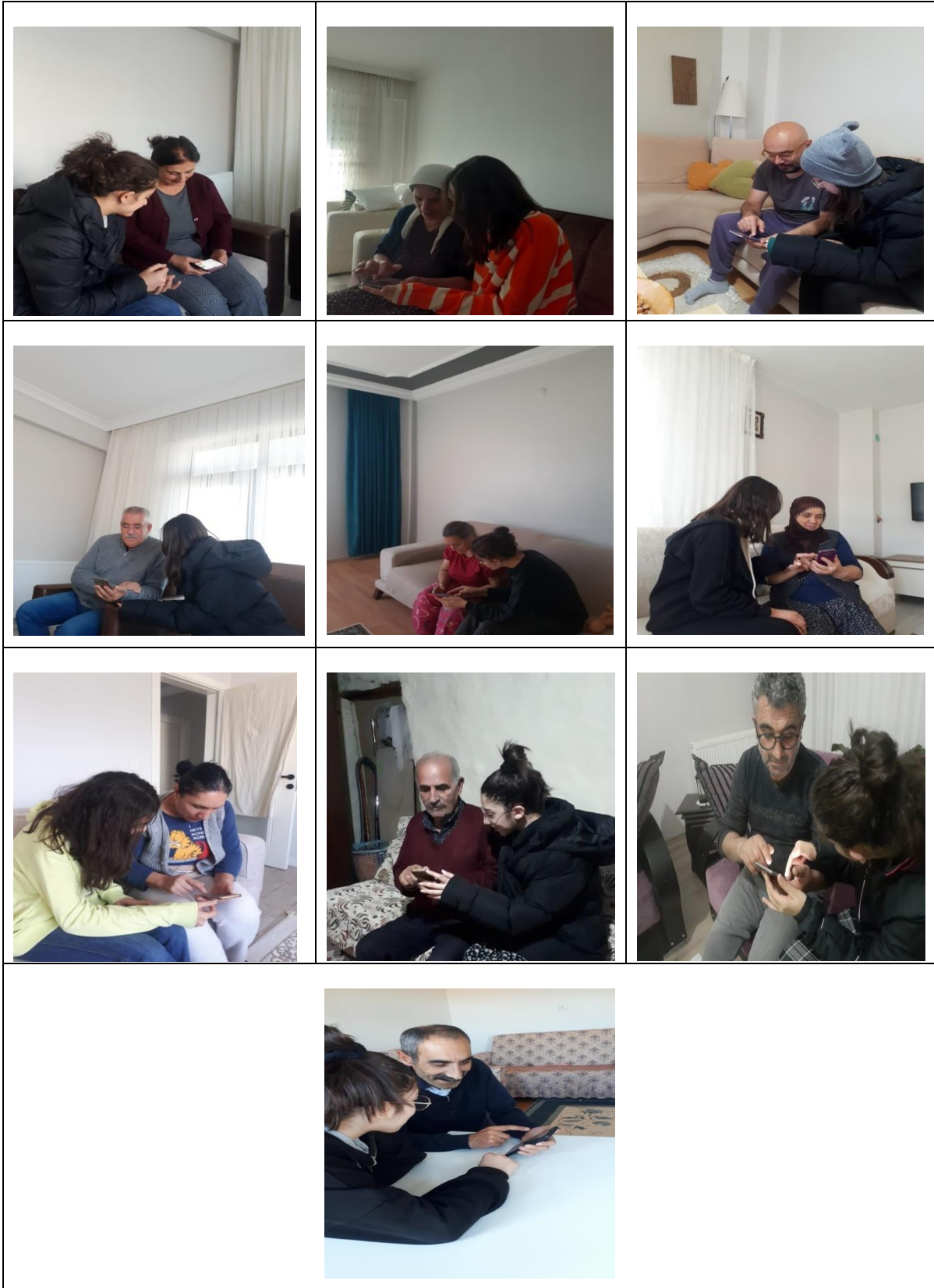
Ek 1: Dijital koçluk uygulamaları